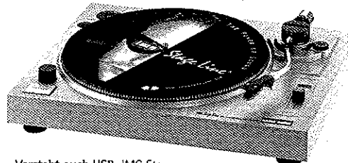
Versteht auch USB: IMG Stage Lines DJP-104 USB

Der neue IMG Stage Line Stereo-HiFi-Plattenspieler DJP-104 USB mit integriertem USB-Port erlaubt die Digitalisierung von analogen Vinyl-Schallplatten. Die Stärke des Audio-Signals über den USB-Ausgang kann über einen Gain-Regler