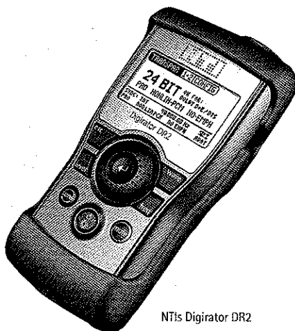
NTi Digirator DR2